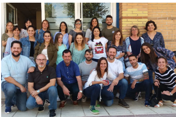
Formación en Gestión del Tiempo

Durante este año hemos llevado a cabo varias acciones formativas con el objetivo de mejorar nuestros conocimientos y hemos organizado nuestra segunda jornada de convivencia, fomentando la unión y el sentimiento de pertenencia a la entidad.