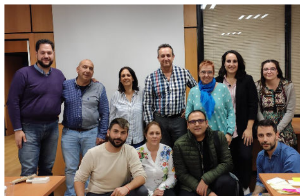
Formación en Captación de Fondos