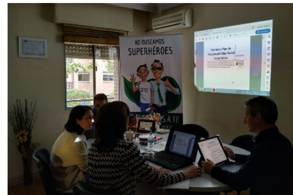
Reunión de seguimiento equipo de calidad EFQM