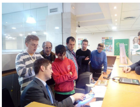
Apoyo para la administración económica