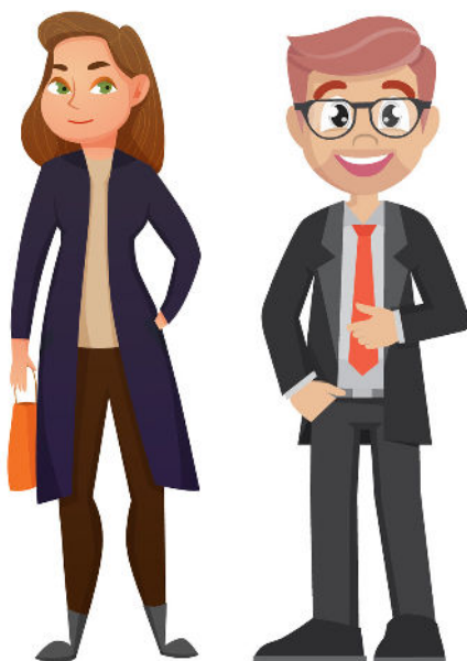
226 (ENTRE 41 Y 60 AÑOS)