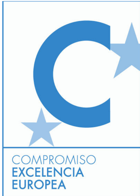
Compromiso con la excelencia EFQM

Seguimos desarrollando los 3 proyectos de mejora, recogidos en el proceso de calidad EFQM.