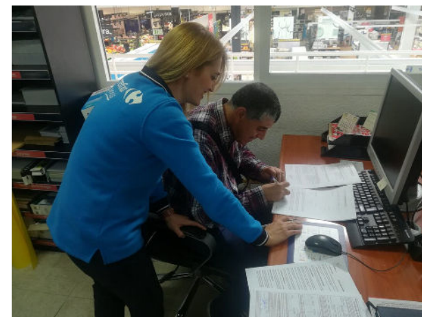
Apoyo al Empleo