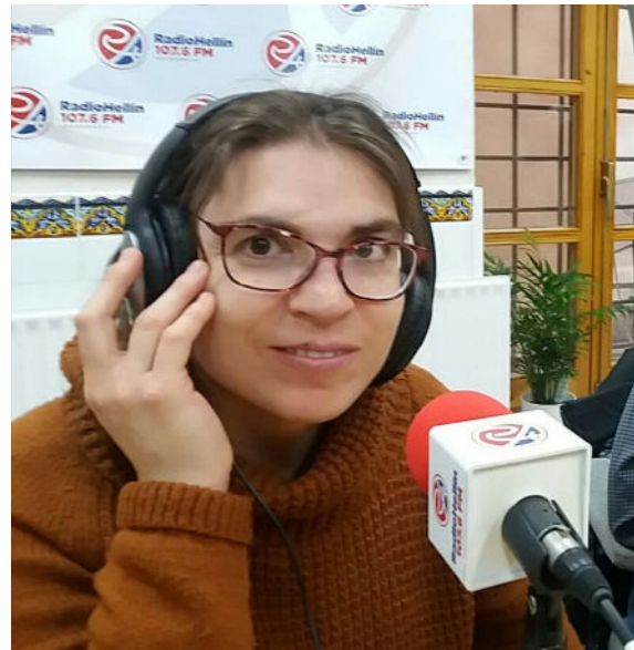
Entrevistas en radio y prensa