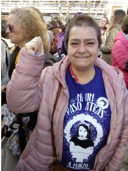
Participación en actos en favor de una sociedad más justa

Hemos llegado a nuevos acuerdos de colaboración con instituciones del conocimiento, reforzado nuestra presencia en redes sociales y el Equipo de Accesibilidad ha seguido trabajando para conseguir la adaptación de documentación de interés para las personas que apoyamos, así como para la adaptación de nuestros propios espacios de trabajo.