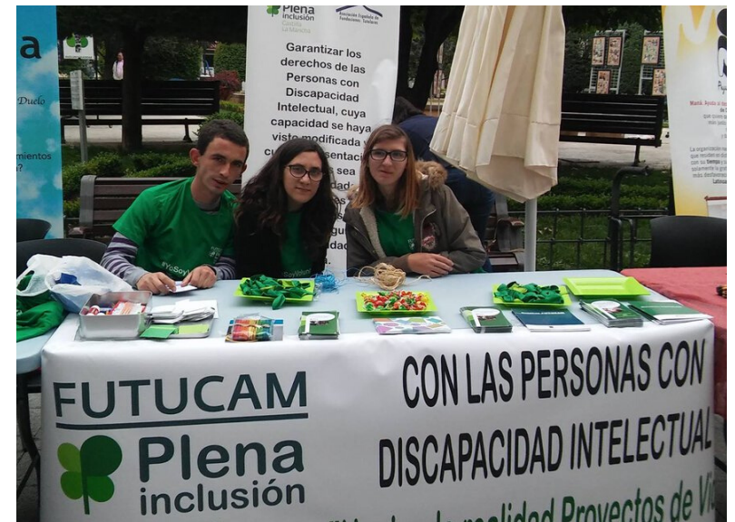
Participación en ferias y eventos en comunidad