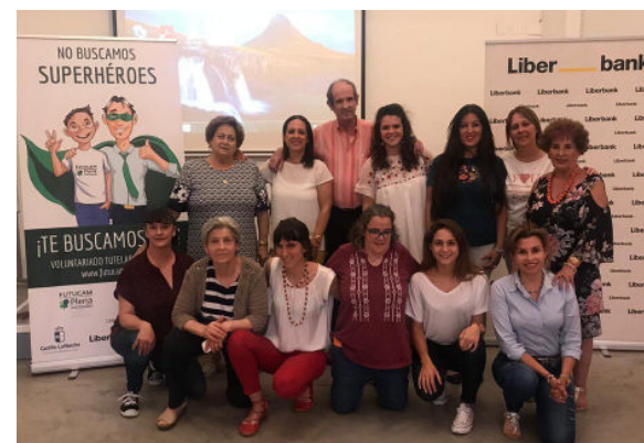
Formación en Inteligencia Emocional