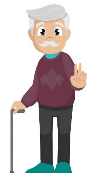
88 (MAYORES DE 60 AÑOS)