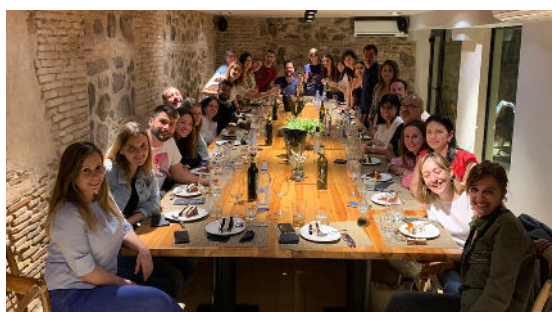
II Jornada de Convivencia Equipo FUTUCAM