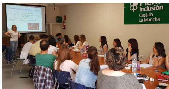
Formación en Salud Mental y ACP