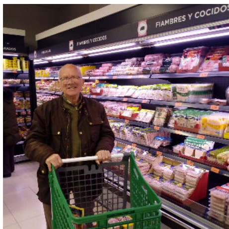
Apoyo a la Vida Independiente

Mantenemos el compromiso con la ética y la mejora continua, durante este año 2019, prestando apoyos en diferentes ámbitos, como vida independiente, empleo, autodeterminación... todo ello alineado con el proceso de transformación y de empoderamiento de las personas apoyadas, denominado en FUTUCAM "De la Presencia a la Participación".