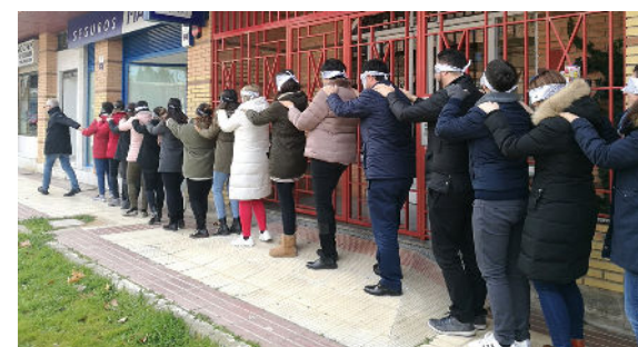
Formación en Crecimiento Personal