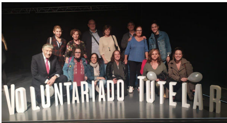
Encuentro Estatal de Voluntariado Tutelar AEFT

Desde aquí agradecerles su dedicación y su tiempo.