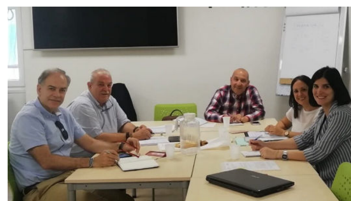
Grupo de Trabajo Técnico AEFT