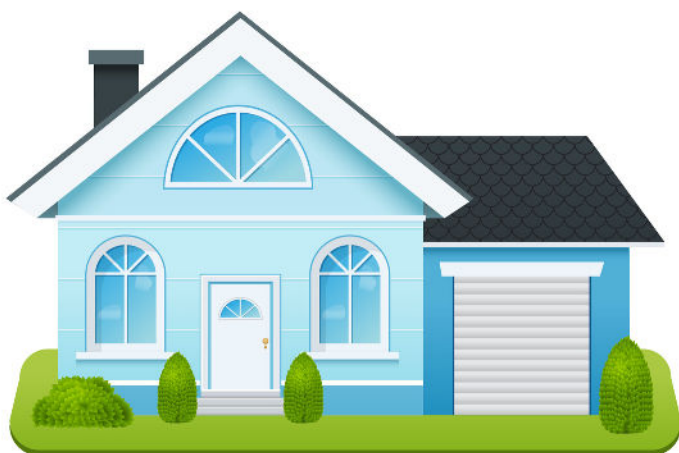
84 EN DOMICILIO PARTICULAR