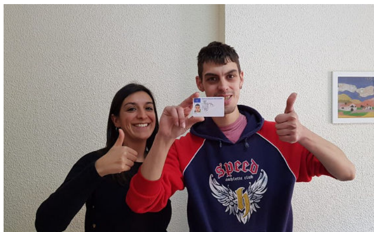
Apoyo para la consecución de objetivos personales