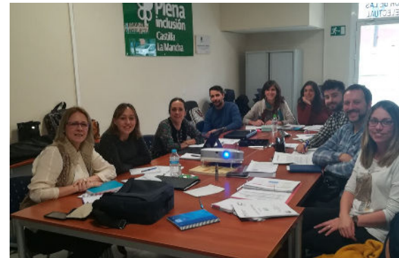
Reunión equipo autoevaluador EFQM