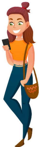
121 (ENTRE 18 Y 40 AÑOS)